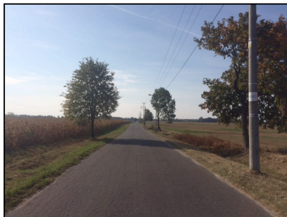
ulica Południowa Zaborów