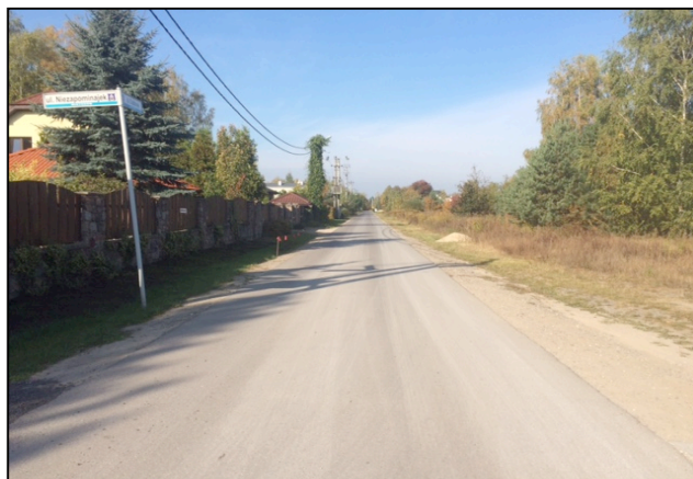
ulica Chabrowa Wiktorów