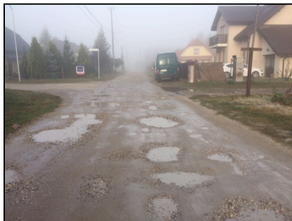
ulica Leśna we wsi Wyględy

Jak ważne jest sprawne skomunikowanie z centrum kulturalnym, jakim dla mieszkańców naszego rejonu zabudowy jednorodzinnej jest centrum Zaborowa, świadczy także przykład modernizowanej częściowo w tym roku ulicy Południowej łączącej Zaborów z Feliksowem. Identyczne funkcje pełni także zlokalizowana w Zaborowie ulica Środkowa - wykonana z kostki brukowej wraz z przyległym do niej chodnikiem, która na odcinku od ulicy Leśnej w Zaborowie do ulicy Wiosennej pełni wyłącznie funkcje obsługi przyległych posesji, a jednocześnie posiada alternatywne i zdejmujące z niej ruch, równoległe biegnące drogi dojazdowe po obu jej stronach (droga wojewódzka numer 580 po jednej stronie i ulica Leśna we wsi Wiktorów/Zaborów jako droga asfaltowa z wydzieloną częścią dla pieszych, wykonana z kostki brukowej po drugiej stronie ulicy Środkowej).