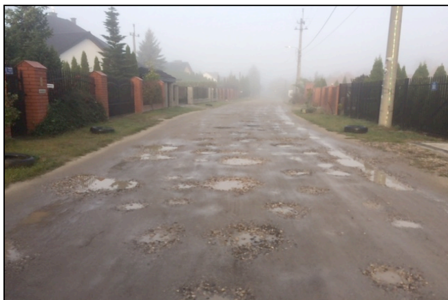
ulica Leśna we wsi Wyględy

Jak wcześniej wspomniano, tego typu rozwiązania doprowadzające asfaltem ruch lokalny do asfaltowej ulicy Topolowej zastosowano również w miejscowości Wiktorów, inwestycją przeprowadzoną w roku 2015 w ramach podniesienia standardu ulicy Chabrowej, co podkreśla, że wniosek mieszkańców wpisuje się we wcześniejszą politykę Rady Gminy w zakresie finansowania bliźniaczo podobnych zadań inwestycyjnych polegających na podłączeniu ruchu z dróg dojazdowych do (tej samej w obu przypadkach) ulicy Topolowej łączącej się z drogą wojewódzką numer 580.