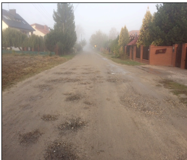
ulica Leśna we wsi Wyględy

Ulica Leśna w miejscowości Wyględy stanowi bezpośrednie przedłużenie ulicy Leśnej z miejscowości Zaborów. Pomimo faktu, że na terenie wsi Zaborów jest to droga powiatowa, gmina Leszno współfinansowała jej modernizację, dostrzegając status tej drogi i jej znaczenie lokalne. Biorąc pod uwagę, że przedmiot inwestycji stanowi bezpośrednie przedłużenie ulicy Leśnej z kierunku Zaborowa, wykonanie tego zadania zdaje się wpisywać w przyjęte wcześniej rozwiązania dla tego ciągu komunikacyjnego łączącego wsie Wiktorów, Wyględy i Zaborów z centrum Zaborowa.