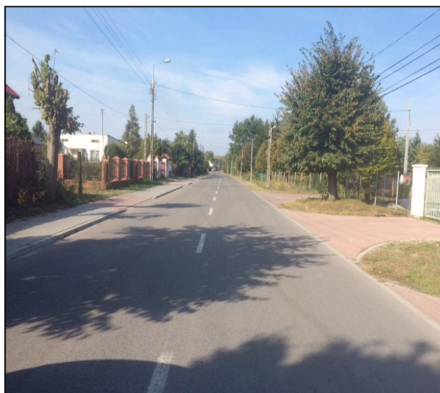
ulica Leśna na odcinku Wiktorów - Zaborów

Jak wcześniej wspomniano, tego typu rozwiązania doprowadzające asfaltem ruch lokalny do asfaltowej ulicy Topolowej zastosowano również w miejscowości Wiktorów, inwestycją przeprowadzoną w roku 2015 w ramach podniesienia standardu ulicy Chabrowej, co podkreśla, że wniosek mieszkańców wpisuje się we wcześniejszą politykę Rady Gminy w zakresie finansowania bliźniaczo podobnych zadań inwestycyjnych polegających na podłączeniu ruchu z dróg dojazdowych do (tej samej w obu przypadkach) ulicy Topolowej łączącej się z drogą wojewódzką numer 580.