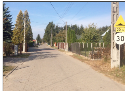
ulica Środkowa Zaborów

Faktem bezdyskusyjnym jest, iż charakter tej inwestycji rozumiany jako skomunikowanie skupisk mieszkaniowych z drogami wylotowymi, jest identyczny z podobnymi inwestycjami wskazanymi powyżej, a sam zamiar inwestycyjny stanowi wypełnienie potrzeb nałożonych na ten odcinek ulicy Leśnej uchwałą Rady Gminy z 2000 roku, w której wskazano ten fragment jako główną drogę dojazdową dla dynamicznie przyrastającej liczby osiedli domów jednorodzinnych zlokalizowanych do realizacji uchwałami Rady Gminy Leszno w tym rejonie.